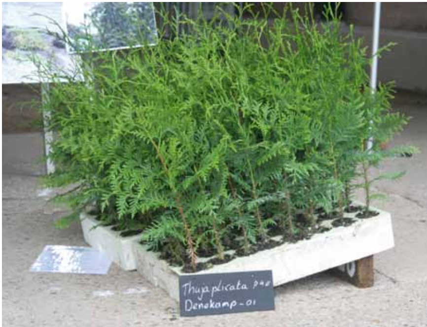
Thuja P40 in de groeiplaat.

De hergroei van de pluggen is beter dan van naaktwortelig materiaal. Bij naaktwortelig zien we dat de planten in het eerste jaar veelal een korte nieuwe scheut vormen als gevolg van de plantschok, maar pluggen groeien gelijk door en hebben een meer normale scheutlengte. Vooral bij de douglas is dat opvallend. Wildschade in het eerste seizoen is nauwelijks geconstateerd.