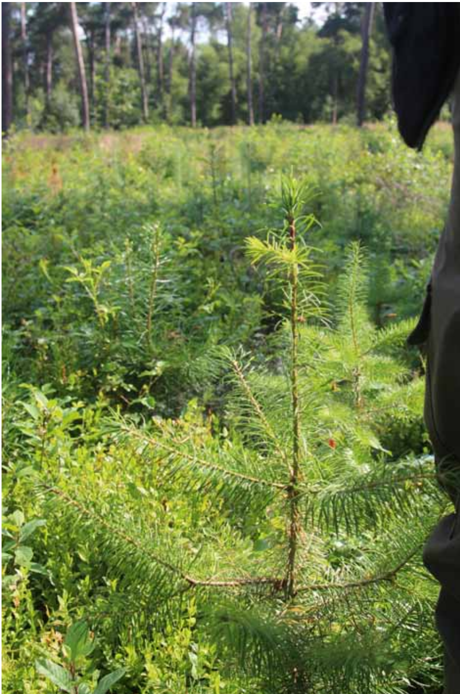
Scheut douglasplug in eerste groeiseizoen.

Maximale plantmaat voor pluggen. Plugplantsoen moet niet te groot en te betakt zijn. De plant moet door de plantbuis kunnen zakken en daarbij