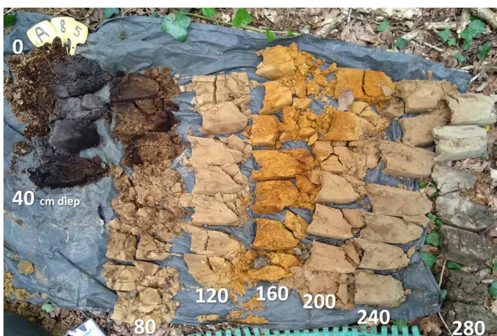
Figuur 2. Voorbeeld bodemprofiel, uitgelegd in klassen van 40 cm. Onder deze haarpodzolgrond zit een kleilaag op 260 cm diepte (zwarte laag).

Bodemkenners kunnen vervolgens het bodemtype determineren met de determinatietabel van De Bakker & Schelling (1989) .