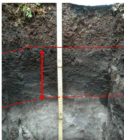
Figuur 4. Bodemprofiel met uitzonderlijk dikke H-laag (rode pijl) van 15 cm dik.

Actie Steek met een spade een plag van ongeveer een spadebreedte en -diepte. Leg de plag voorzichtig op zijn kant zodat de humuslaag zoveel mogelijk intact blijft. Beoordeel met welke humusvorm u te maken heeft (zie inleidende tekst en foto’s). Betreft het een morhumusvorm? Bekijk of er een zwarte, schoensmeerachtige laag aanwezig is, zonder zandkorrels. Indien deze H-laag dikker is dan pakweg 2 cm, betreft het vermoedelijk een oude, van nature zure bosgroeiplaats. Er dient terughoudend te worden omgegaan met maatregelen ter behoud van deze waardevolle, oude humuslaag.