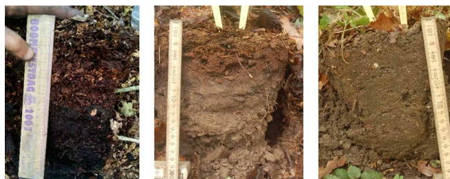
Figuur 3. De drie humusvormen, van links naar rechts mor, moder en mull.

Het bodemtype geeft een goed beeld van de bosgroeiplaats, maar wel vooral van lange-termijngeschiedenis. Veranderingen in boomsamenstelling, bodem-pH en voedselrijkdom komen sneller (binnen decennia) tot uiting in de humusvorm. In het bodemprofiel kan dat daarentegen wel honderden tot duizenden jaren duren. 1 Schimmels en micro-organismen zorgen ervoor dat strooisel wordt gefragmenteerd, afgebroken, gehumificeerd en al dan niet met de minerale ondergrond wordt vermengd (bioturbatie).